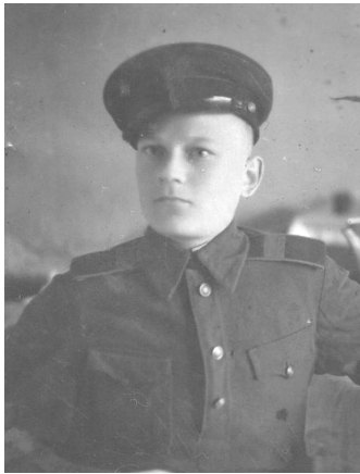
ФОТО 1944 г.

подвиги, бросаясь на амбразуры и танки с гранатой в руке. Героями были те, кто погиб или совершил неординарный героический поступок. И лишь через много - много лет пришло осознание того, что победу в той страшной войне одержали не только те, кто пришел с войны с боевыми наградами, но и рядовые пехотинцы, связисты и санитарки, техники и те, кто рыл бесконечные окопы в прифронтовой полосе. Они редко награждались медалями и почти никогда - орденами.