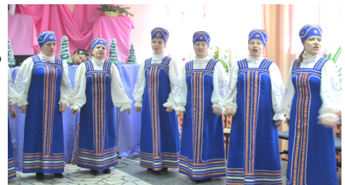
Ансамбль «Горенка» из п. Мелиоративный - гости «Крещенских посиделок»