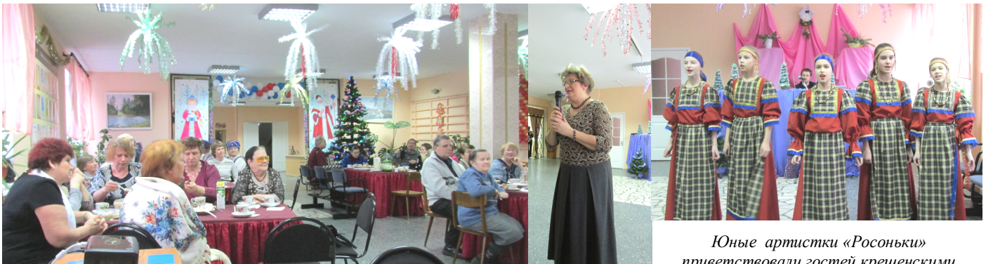
Юные артистки «Росоньки» приветствовали гостей крещенскими песнями и калядками

Вслед за Новым годом и Рождеством наступило Крещение - один из главных христианских праздников. В крещенский сочельник в Нововилговском Доме Культуры состоялись традиционные «Крещенские посиделки». Снова встретились друзья и добрые соседи. За чашкой душистого чая с пирогами отдохнули и повеселились от души. И все обычаи благодаря хозяевам праздника соблюли: и «голодной кутьи» отведали и в последних святочных гаданиях поучаствовали и