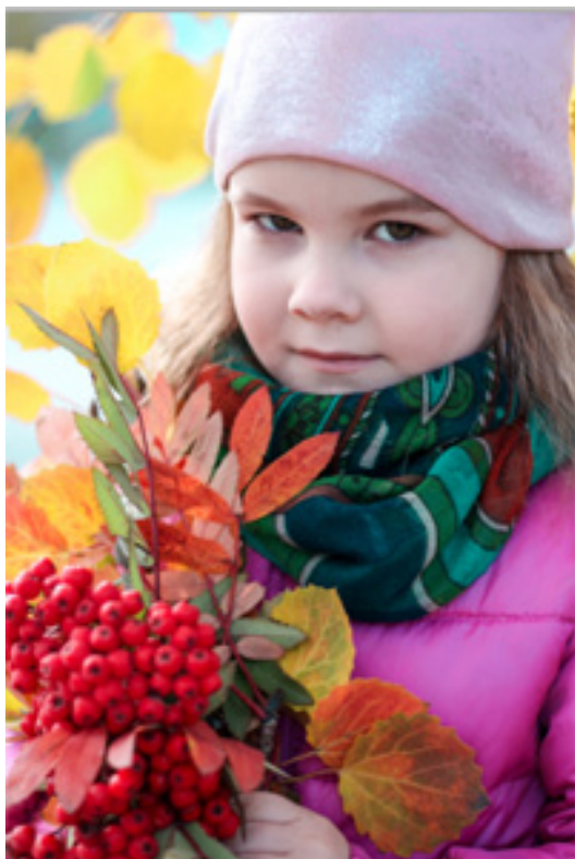
Фото работа «Осени шаги»

КРОО ПСП «Дошкольник» г. Красноярск, ул. Академгородок 30-21, e-mail: doshkolnik@list.ru