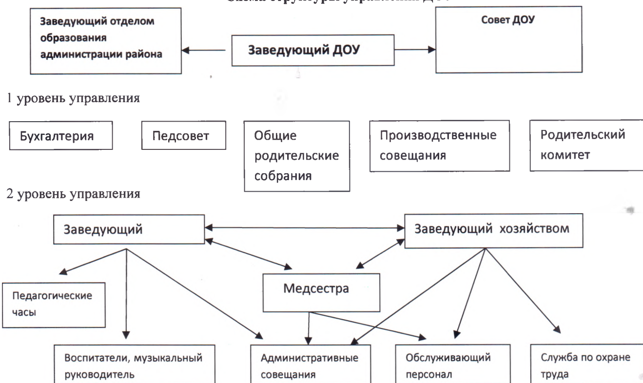
Схема структуры управления ДОУ