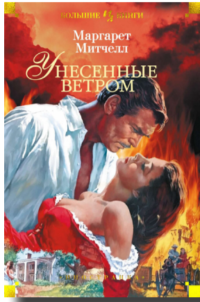
«Унесенные ветром» Маргарет Митчелл

Скарлетт О'Хара – один из самых известных женских персонажей, олицетворяющий стремление к успеху и готовность добиваться поставленной цели, несмотря на преграды. «Унесенные ветром» считается романом о гражданской войне, вспыхнувшей между Севером и Югом, однако автор больше сосредоточилась именно на характере героини.