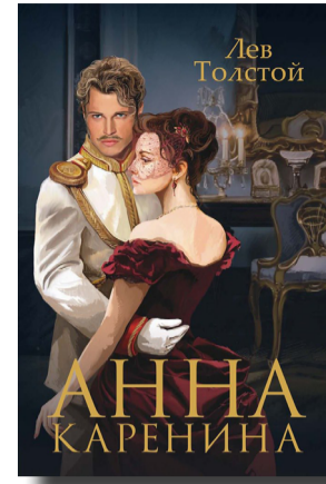
«Анна Каренина» Лев Толстой

Книга описывает жизнь девочек, живших в середине XIX века. Вопреки неумолимому течению времени, роман остается актуальным, поскольку главной сюжетной линией в нем стали взаимоотношения в семье. Сестры Марч являют все разнообразие женских характеров: Мег чопорна и тщеславна, Джо своенравна и прямолинейна, Эми хитрее дьяволенка, а вот Бет – сущий ангел.