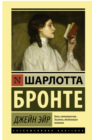
«Джейн Эйр» Шарлотта Бронте

Скарлетт О'Хара – один из самых известных женских персонажей, олицетворяющий стремление к успеху и готовность добиваться поставленной цели, несмотря на преграды. «Унесенные ветром» считается романом о гражданской войне, вспыхнувшей между Севером и Югом, однако автор больше сосредоточилась именно на характере героини.