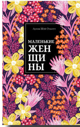
«Маленькие женщины», Луиза Мэй Олкотт

Судьба Джейн Эйр некоторыми деталями напоминает жизнь ее автора, однако не стоит полагать, будто Бронте посвятила роман самой себе, поскольку Джейн – вполне самостоятельный образ. Главная героиня романа символизирует собой все те горести, с которыми вынуждены столкнуться бедные сироты.