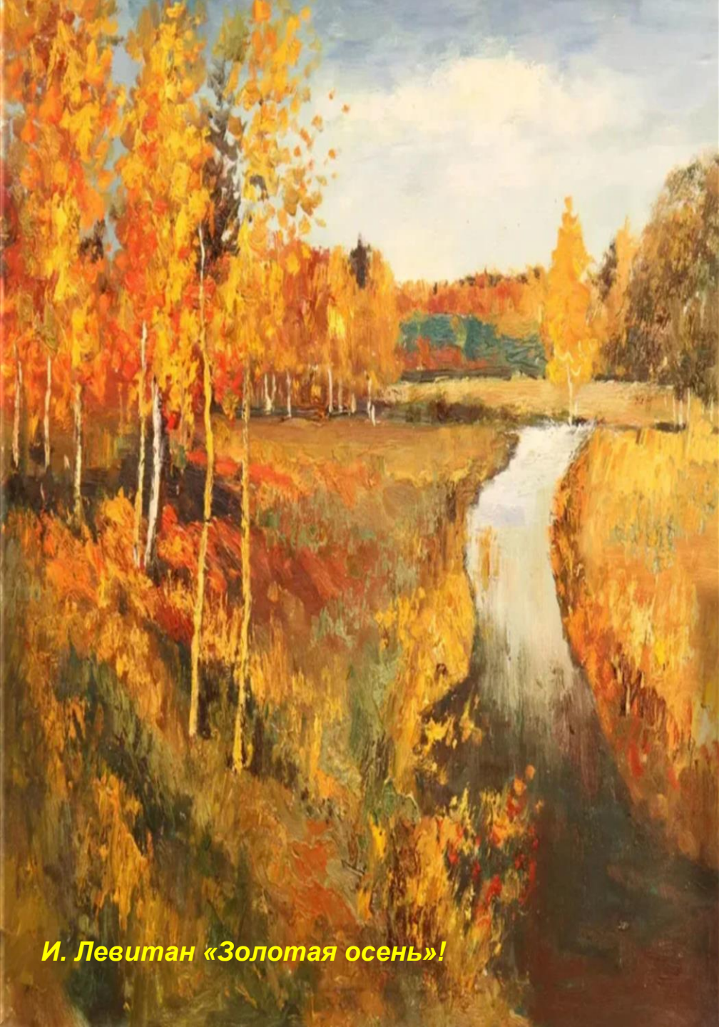
И. Левитан «Золотая осень!»