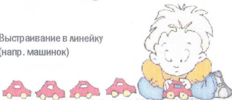
Выстраивание в линейку (напр. машинок)