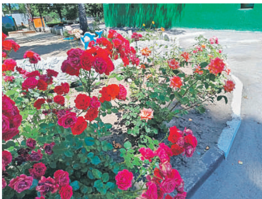
Детсад № 48 «Вишенка» г. Белгорода