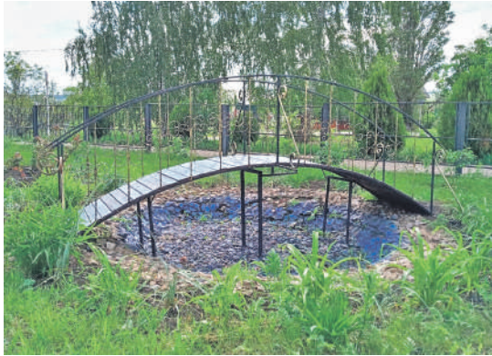
Уразовская школа № 2 Валуйского городского округа