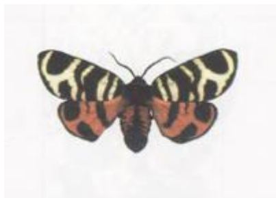
Arctia (=Ammobiota) hebe (Linnaeus, 1758)