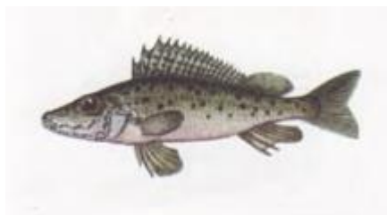
Licioperca volgensis (Gmelin, 1788)