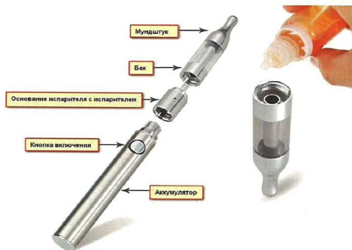
Рис. 3. Устройство электронной сигареты

Обычная электронная сигарета состоит из аккумулятора, электрического испарителя, емкости для жидкости, мундштука и дополнительных элементов для автоматического управления подачей ароматической жидкости (но последние имеются не во всех моделях), рис.3.