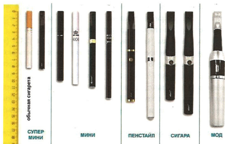
Рис.4. Типы и размеры электронных сигарет

Электронные сигареты (вейпы) классифицируются также по типу и размеру (рис.4) в соответствии с длиной (от 82 мм до 175 мм).