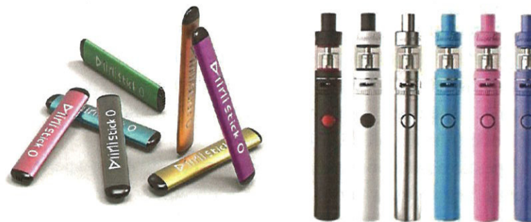
Рис. 5. Одноразовые (слева) и многоразовые (справа) электронные сигареты

Одноразовые ЭС рассчитаны на 200 - 500 затяжек пара. В многоразовых устройствах нет таких ограничений и они работают до тех пор, пока доливается жидкость в емкость.