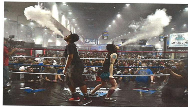
Рис. 2. Вейпинг соревнование

В Москве в 2019 году была проведена девятая по счету выставка VapeExpo.