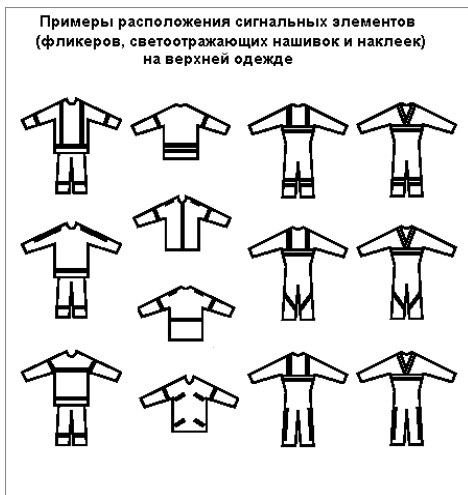
Рис.1. Примеры расположения сигнальных элементов (фликеров, светоотражающих нашивок и