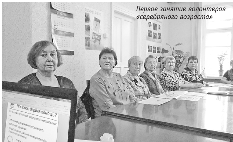
Первое занятие волонтеров «серебряного возраста»

В рамках месячника пожилых людей в Березниках при Российском обществе Красного Креста проходит восьмичасовая учеба для бывших медицинских работников больницы имени Вагнера (а ныне пенсионеров), пожелавших в качестве волонтеров оказывать помощь своим коллегам, не покидающим квартиры по состоянию здоровья.