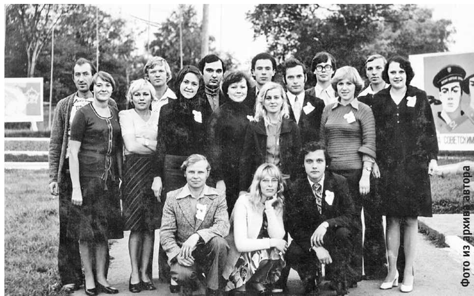
Областной семинар вторых секретарей райкомов ВЛКСМ, г. Пермь, 1978 год