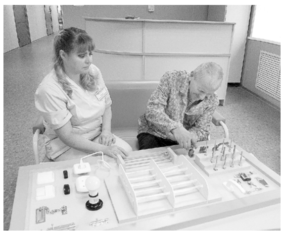
Реабилитационная панель служит для разработки тактильных навыков

На пятом этаже стационара кизеловской больницы открылось после ремонта отделение сестринского ухода. Оно принимает жителей Кизела, Губахи и Гремячинска.