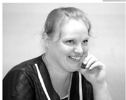
Работники экспедиции – первые читатели газет