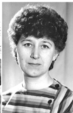
Фото с Доски почета