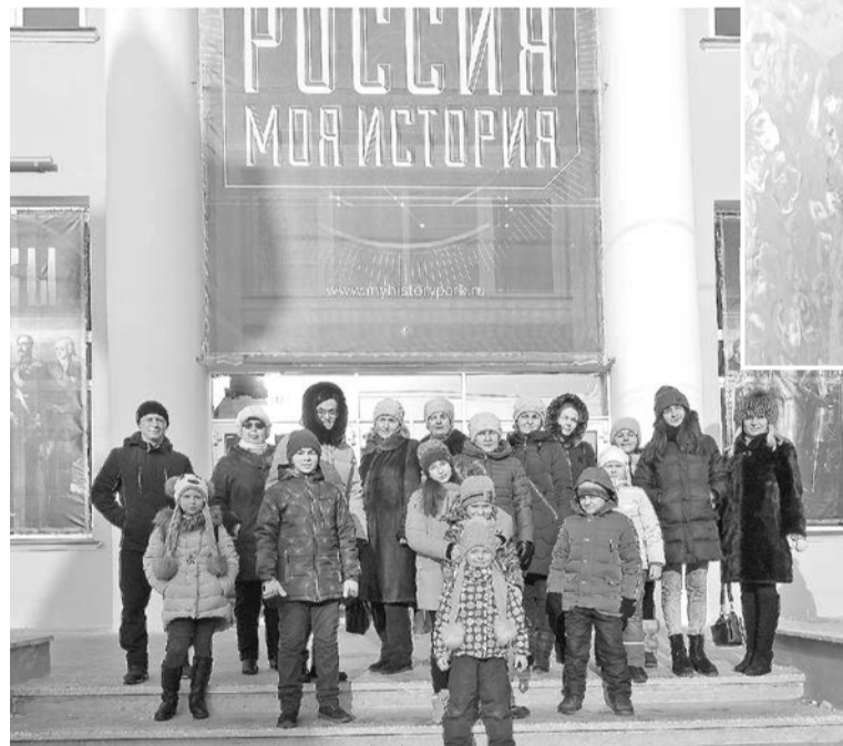
Бумажники открыли для себя интереснейший музей – мультимедийный исторический парк «Россия – Моя история»

Во-вторых, в этом необычном музее использованы приемы видеоинфографики, анимации, трехмерного моделирования и цифровых реконструкций. На экранах и сенсорных панелях размещена информация о главных исторических событиях прошлого. Можно просто почитать и посмотреть картинки, а можно пройти тест, прогуляться по виртуальным древним городищам и даже поучаствовать в сражении. Экспозиция украшена спецэффектами: например, в зале, посвященном Крещению Руси, на полу с помощью проек-