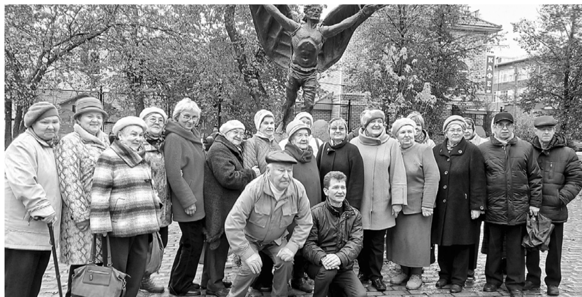
Фото на память у памятника Никите Летуну в г. Кунгуре

Совет ветеранов аппарата Пермского крайсовпрофа стремится жить интересной, насыщенной жизнью