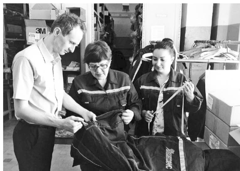
Процесс контроля поступившей спецодежды

Регулярно на центральный склад компании «Метафракс» поступают партии новеньких спецовок, защитных костюмов, комбинезонов, курток, халатов, ботинок, сапог, перчаток... И так же регулярно эти поставки проходят строгий контроль.