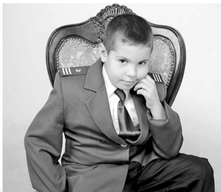
Фоторабота Ольги Тетеновой «Я б в начальники пошел, пусть меня научат!»