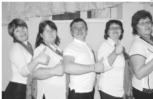
Команда «Алфавит» (второе место)