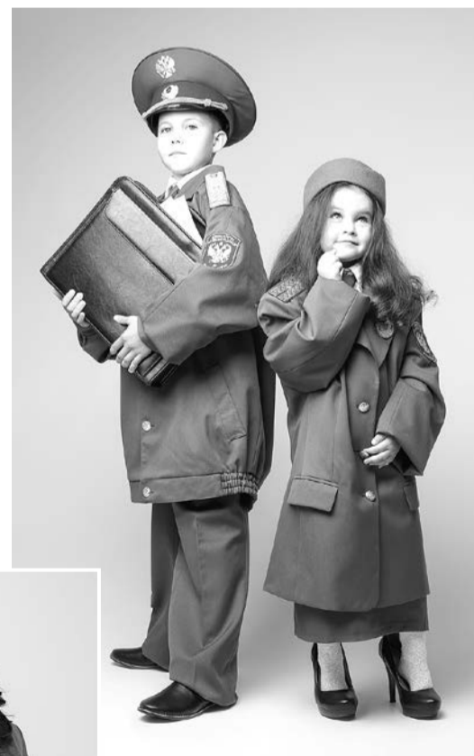
Фоторабота Елены Селивановой «Когда я вырасту, то буду, как папа! А я как мама!»