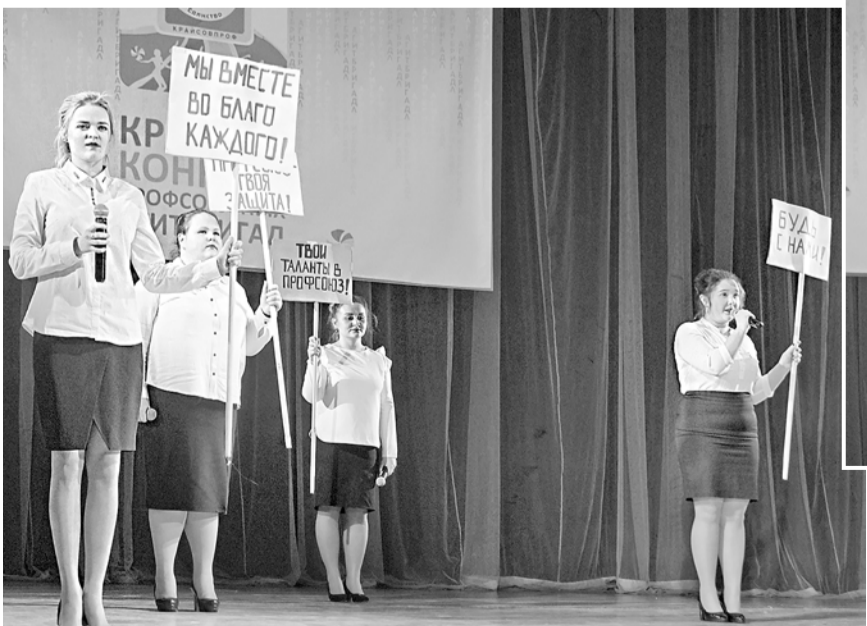
«Нет другого профсоюза у меня»