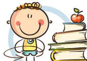
3. ФИЗКУЛЬТМИНУТКА ДЛЯ СНЯТИЯ УТОМЛЕНИЯ КОРПУСА ТЕЛА