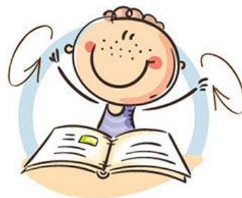
2. ФИЗКУЛЬТМИНУТКА ДЛЯ СНЯТИЯ УТОМЛЕНИЯ С ПЛЕЧЕВОГО ПОЯСА И РУК