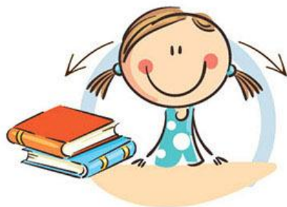
1. ФИЗКУЛЬТМИНУТКА ДЛЯ УЛУЧШЕНИЯ МОЗГОВОГО КРОВООБРАЩЕНИЯ