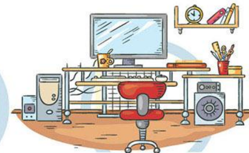
5. СООТВЕТСТВИЕ МЕБЕЛИ