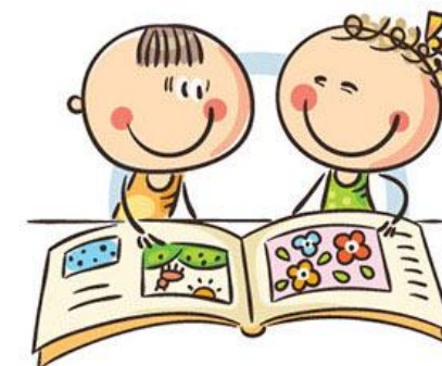
4. УПРАЖНЕНИЯ ГИМНАСТИКИ ГЛАЗ