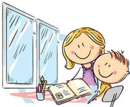
1. ЕСТЕСТВЕННОЕ ОСВЕЩЕНИЕ

ЕДИНЫЙ КОНСУЛЬТАЦИОННЫЙ ЦЕНТР РОСПОТРЕБНАДЗОРА 8-800-555-49-43