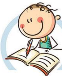
4. СИДИТЕ ПРАВИЛЬНО