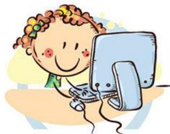
2. ПОЛОЖЕНИЕ МОНИТОРА