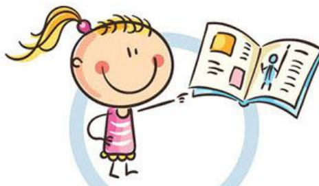
3. РАССТОЯНИЕ ДО КНИГ