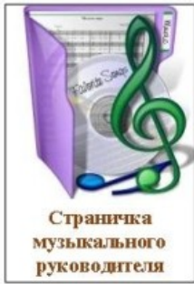
Страничка музыкального руководителя