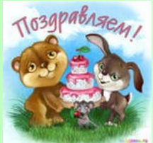
Фото галерея Стр. 14