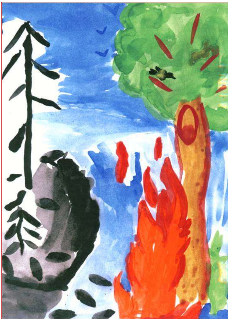
В оформлении использованы детские рисунки

А вместо прежней красоты Лишь обгоревшие кусты, Лишь пепел, черные стволы... И виноват в том, мальчик, ТЫ.