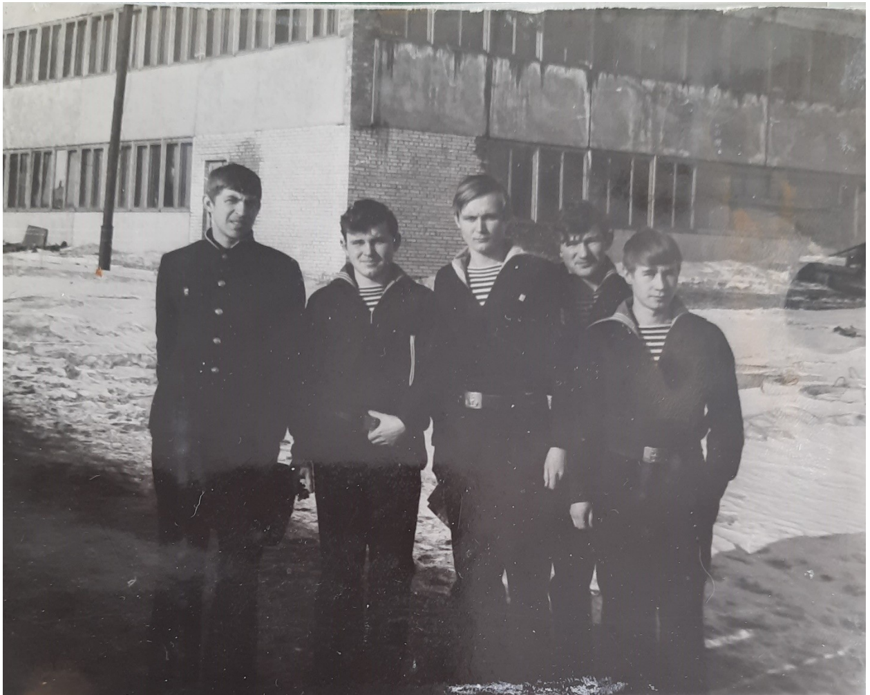
Строительство нашей столовой весной 1971 года.