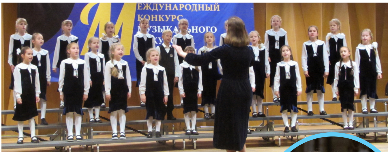
Хористы из 2-го А. Консерватория