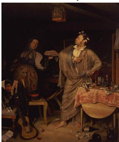
2. П. А. Федотов. «Свежий кавалер».