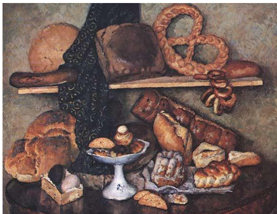
3. И. И. Машков. «Снедь московская. Хлебы».