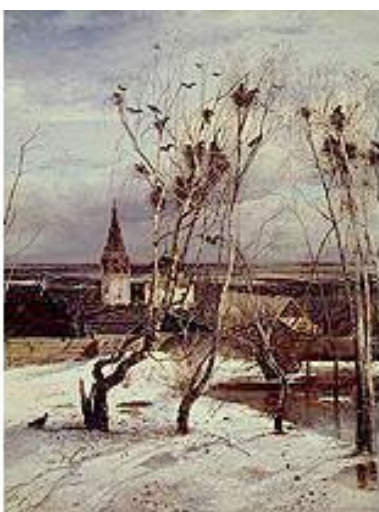
2. «Грачи прилетели».