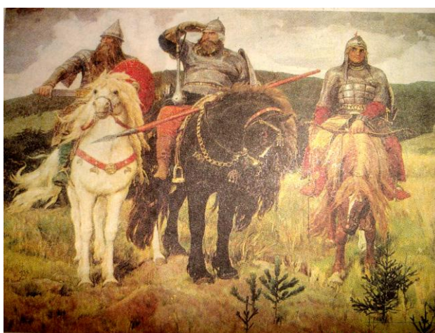
4. Васнецов «Богатыри»