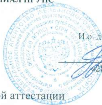
График промежуточной аттестации студентов специальности

23.02.08 Строительство железных дорог, путь и путевое хозяйство на 1-й семестр 2024/2025 учебного года