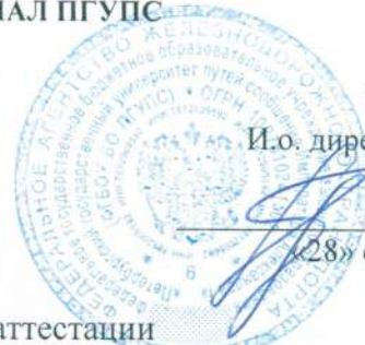
График промежуточной аттестации студентов специальности

23.02.06 Техническая эксплуатация подвижного состава железных дорог на 1-й семестр 2024/2025 учебного года.