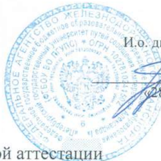
График промежуточной аттестации студентов специальности

23.02.04 Техническая эксплуатация подъемно-транспортных, строительных, дорожных машин и оборудования (по отраслям) на 1-й семестр 2024/2025 учебного года