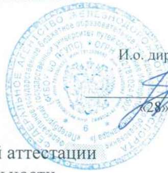
График промежуточной аттестации студентов специальности

23.02.04 Техническая эксплуатация подъемно-транспортных, строительных, дорожных машин и оборудования (по отраслям) на 1-й семестр 2024/2025 учебного года