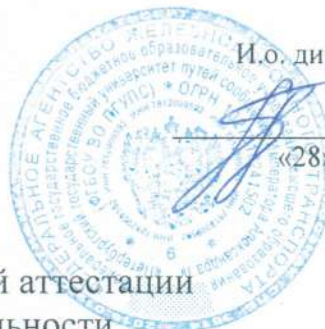
График промежуточной аттестации студентов специальности