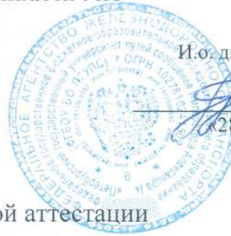
График промежуточной аттестации студентов специальности

23.02.01 Организация перевозок и управление на транспорте (по видам) на 1-й семестр 2024/2025 учебного года.