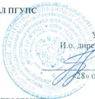
График промежуточной аттестации студентов специальности

23.02.01 Организация перевозок и управление на транспорте (по видам) на 1-й семестр 2024/2025 учебного года.