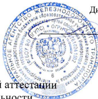
График промежуточной аттестации студентов специальности

09.02.06 Сетевое и системное администрирование на 2-й семестр 2025/2026 учебного года