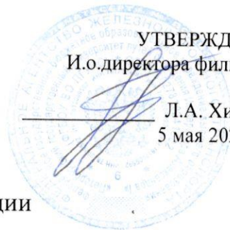
График промежуточной аттестации студентов специальности 09.02.06 Сетевое и системное администрирование на 2-й семестр 2025/2026 учебного года