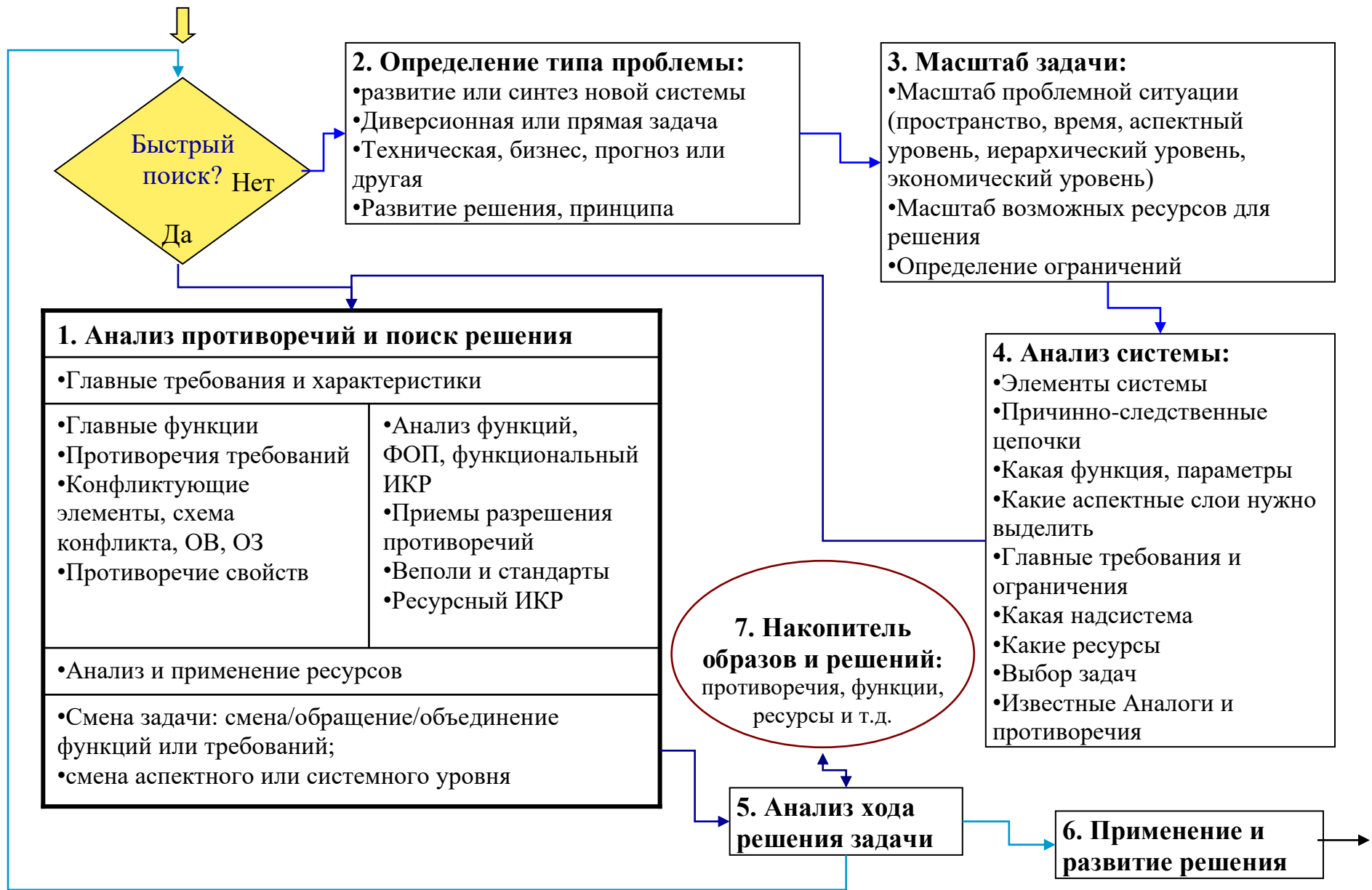
Рисунок 1. Вариант АРИЗ - 2010. Блок-схема.