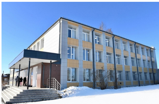
МОУ Шуйская средняя школа №1