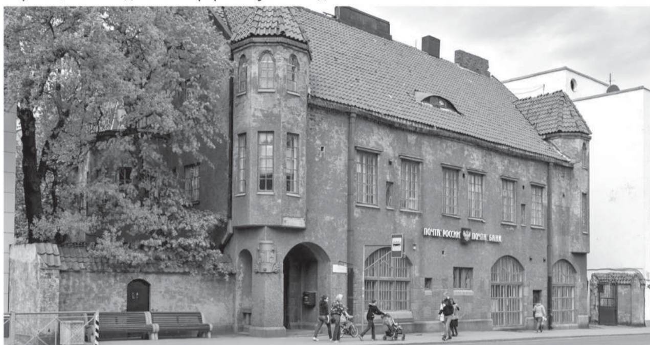
Здание бывшего Объединенного банка Северных стран.

Онлайн-совещание по вопросам развития Сортавальского района стало пятнадцатым в череде подобных встреч, посвященных проблемам районов Карелии. Разговор шел в течение всего дня и касался не только развития района как туристического центра Карелии, но и создания комфортных условий для жизни местных жителей.