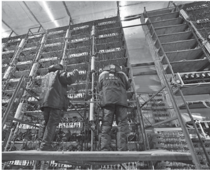
«Сегежская упаковка». Фото: «Республика»/Сергей Юдин

Рабочая поездка Главы Карелии в Сегежский район началась с посещения промышленных объектов.