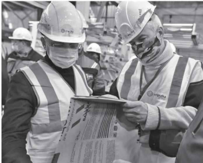
«Сегежская упаковка».

О том, какие изменения ждут район и его промышленность, – в материале «НК».