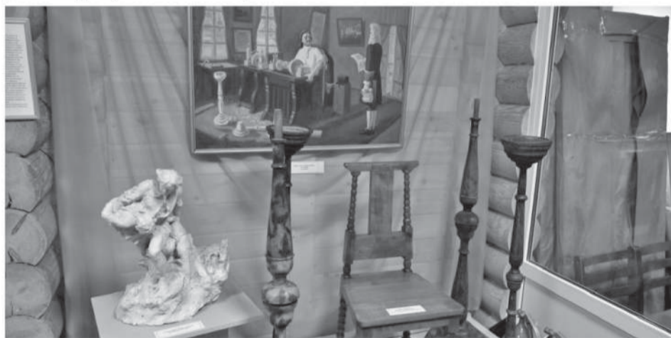
Дом зрителя. Марциальные Воды.

Площадь для выставок увеличилась после реставрации за счет цокольного этажа.