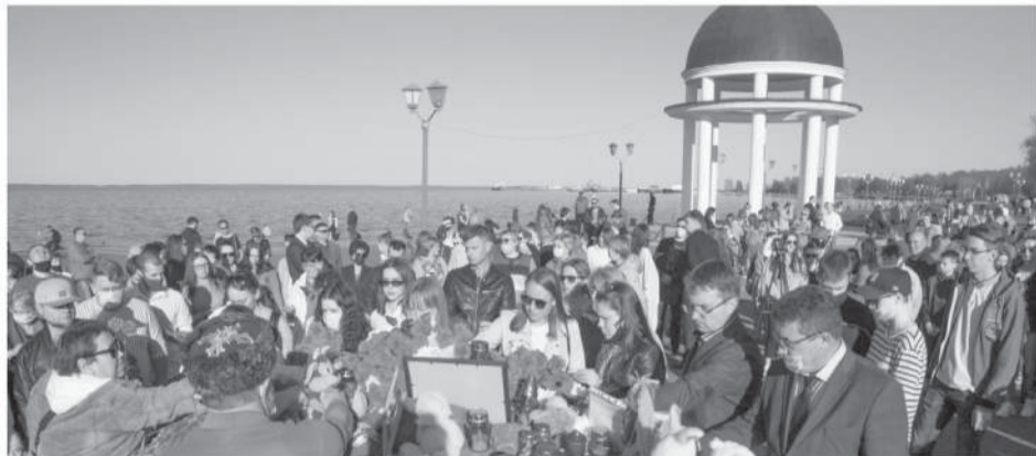
Сотни людей в Петрозаводске пришли к камню скорби после трагедии в Казани.

С учащимися также проведут профилактическую работу.