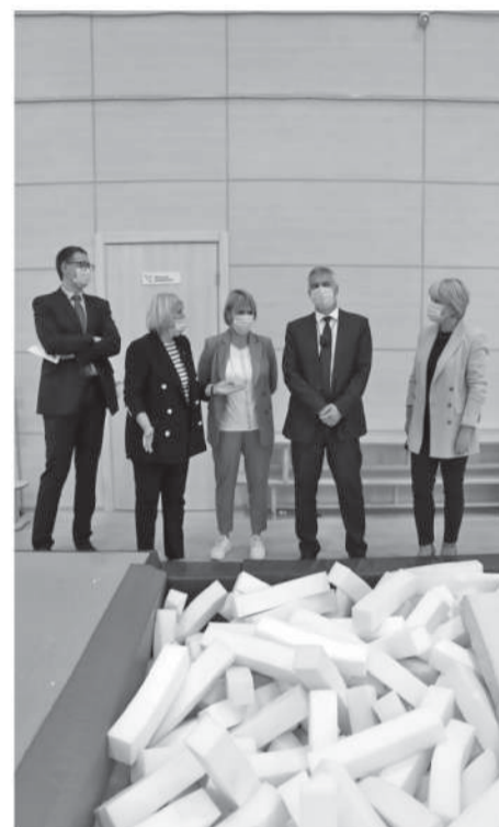
72 млн рублей предусмотрено в федеральном бюджете.

Эти средства пойдут на увеличение заработной платы тренеров, закупку оборудования и инвентаря и участие в тренировочных мероприятиях. Кроме того, еще