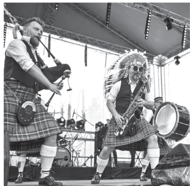
Первый в России оркестр волынщиков

Заключительный концерт «Золотая классика» тоже стал особенным. На сцену вышел Симфонический оркестр Ка-