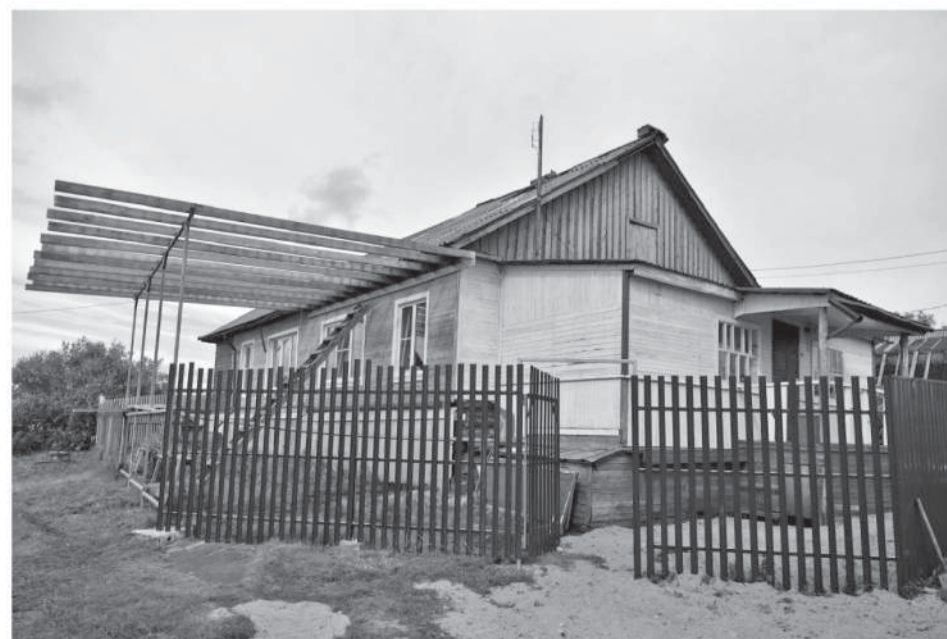
Рабочеостровск, гостевой дом