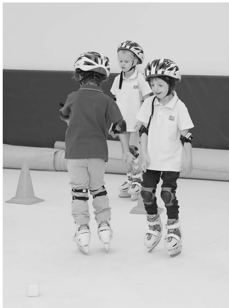
Катание на коньках укрепляет мышцы

Мне кажется, такое отношение - это отголоски неприятия обществом в целом людей с инвалидностью. Но наши выпускники будут уже другим поколением. Для этого мы и делаем свою работу. Изменить сразу всю страну не получится, но каждый может что-то изменить на своем месте. Наши дети, так называемые нормотики, - это мостик между социумом и детьми с ОВЗ. Вы бы видели, как они опекают наших «солнечных» ребят - детей с синдромом Дауна! Приглашают их на дни рождения. А маме «солнечного» ребенка как приятно, что ее пригласили наравне с другими мамами! Ведь, по сути, и у мамы ребенка с синдромом Дауна, и у мамы нормотипика одни и те же проблемы: почему пло-