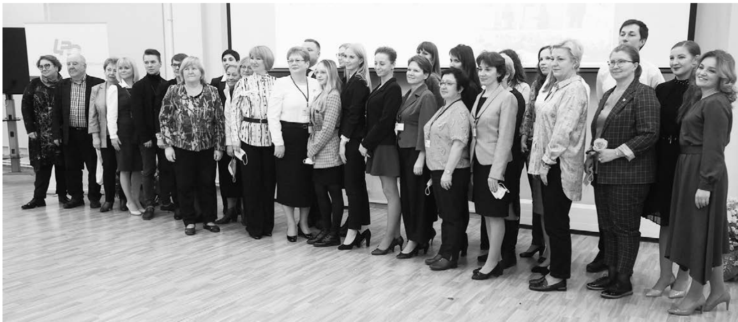
Коллектив Центра развития образования принимает поздравления