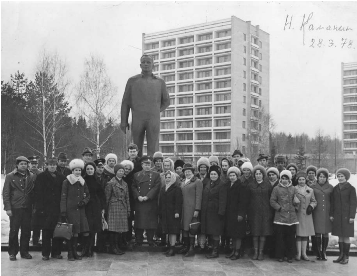
Живая легенда в кругу учителей школы №1. 1978 г.

Проходят годы, но история хранит в людской памяти имена героев, посвятивших всю свою жизнь делу служения нашей Родине. Они не жалели себя и не искали личной выгоды. Всего себя без остатка отдали служению своему народу и Н.П.Каманин - один из первых семи Героев Советского Союза. Человек-легенда, сумевший разглядеть в простом смоленском пареньке Юре Гагарине покорителя космоса.