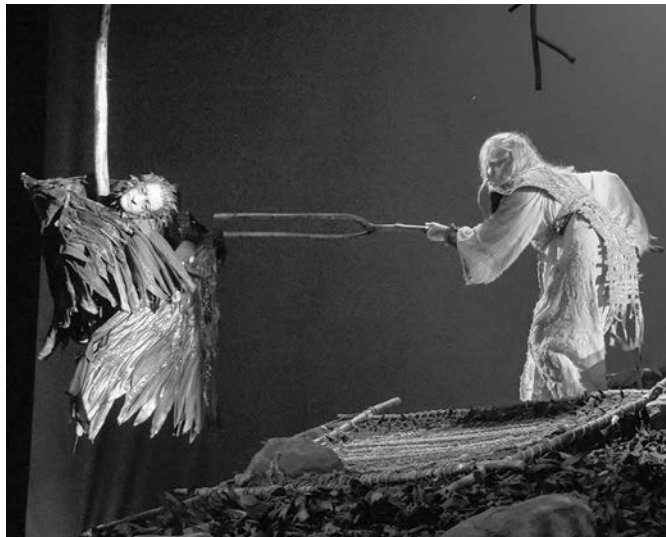
Стихийная гамма подчеркивает языческую составляющую сказки

Все равно, как ни прячься под личиной человека, страшный коготь останется. Живое и мертвое соседствуют настолько тесно, что отделить их порой невозможно: «По традиции дьявола представляют покрытым шерстью, с рогами, хвостом и крыльями, как у нетопыря. Но под звериной маской скрывается человеческое тело. Это, стало быть, не зверь в облике человека, а скорее человек в облике зверя, иными словами, волк в овечьей шкуре», - писал Карел Чапек. И все же только человек с живой душой способен исправить совершенные по недомыслию ошибки.