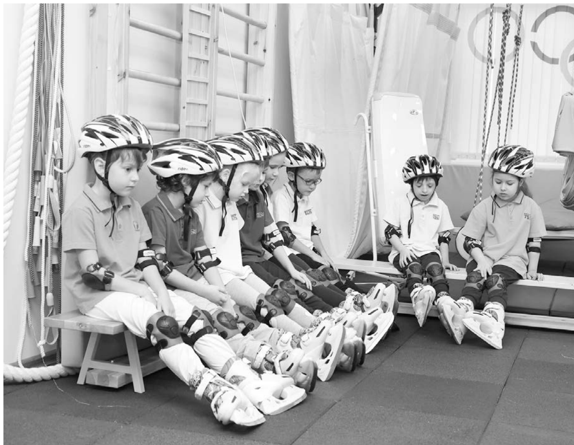
Подготовка к занятиям спортом - дело ответственное

- По моему мнению, идеальный детский сад - когда тепло, уютно, когда все вместе, все друг друга понимают, не нужно ни с кем спорить, не нужно никому ничего доказывать, но это из области фантастики. Так не бывает. У каждого свой путь, у нашего сада такой. Не идеальный, а свой. Каждый ребенок в нем важен, и судьба каждого ребенка требует индивидуального подхода. Наша задача - совместно с семьей по окончании детского сада подобрать ребенку дальнейшую образовательную траекторию, пойдя по которой он будет успешен и по-своему счастлив.