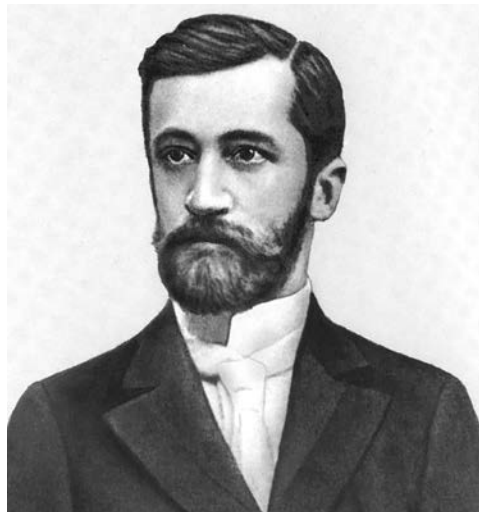
Дмитрий Мережковский изобразил Петра I воплощенным антихристом

К 300-летию Российской империи в Малом театре поставили «Петра I» по пьесе Дмитрия Мережковского «Царевич Алексей». Страшнее спектакля не найти на московских подмостках. Тем паче что среди литературных источников, по которым написана сценическая версия Малого театра, кроме историко-софского романа Мережковского «Антихрист. Петр и Алексей» (пьеса «Царевич Алексей» поставлена по нему) упоминается пьеса Фридриха Горенштейна «Детубийца». По ней в 1985 году в Малом театре был поставлен спектакль с Виктором Коршуновым и Василием Бочкаревым в ролях Петра и царевича Алексея. Новый спектакль о Петре подоспел ко времени - Россия всерьез озаботилась тем, чтобы, по Ломоносову, «прирастать Сибирью» и Дальним Востоком.