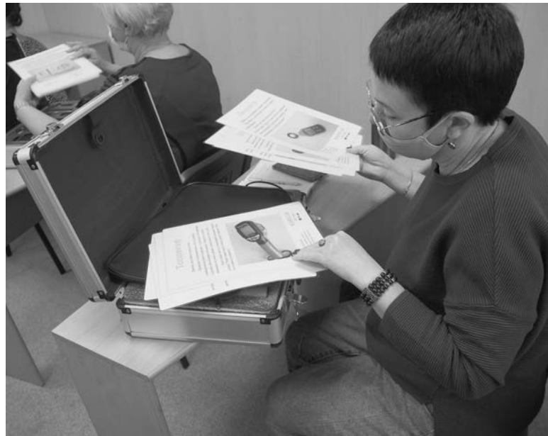
Управляться с новым оборудованием помогут карточки с пояснениями

- Конечно! Когда дети бегают по школе с тепловизором и ищут места, через которые тепло улетает на улицу, - это крайне увлекательно. Очень