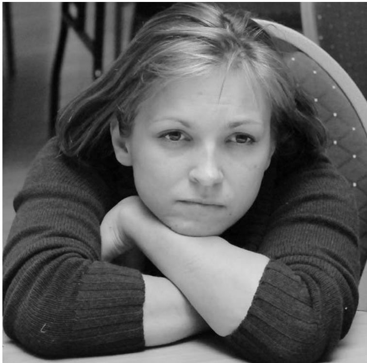
Попробуйте договориться со своим вторым «я»