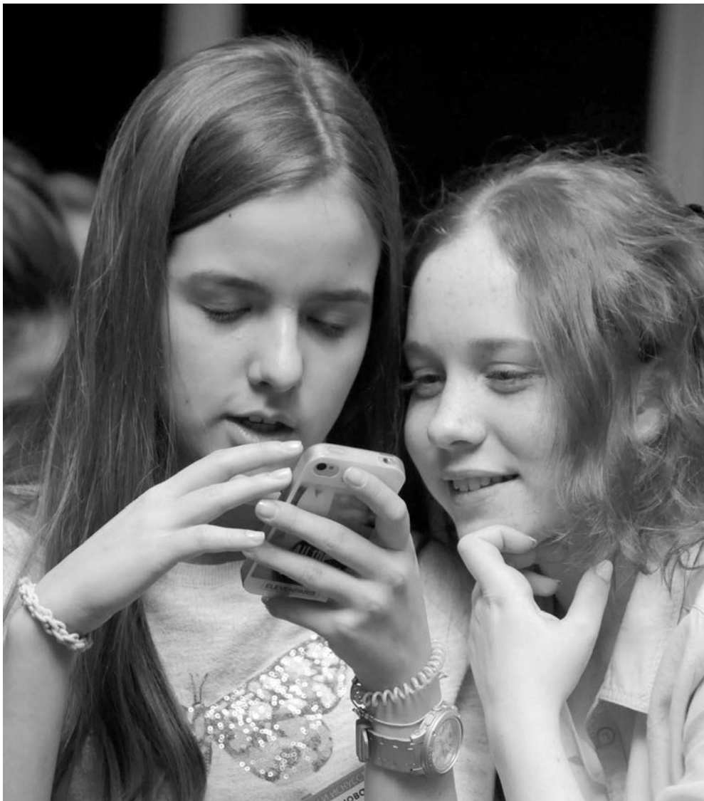
Язык игры универсален и понятен большинству детей

Семь онлайн-сервисов и приложений, которые помогут разнообразить уроки