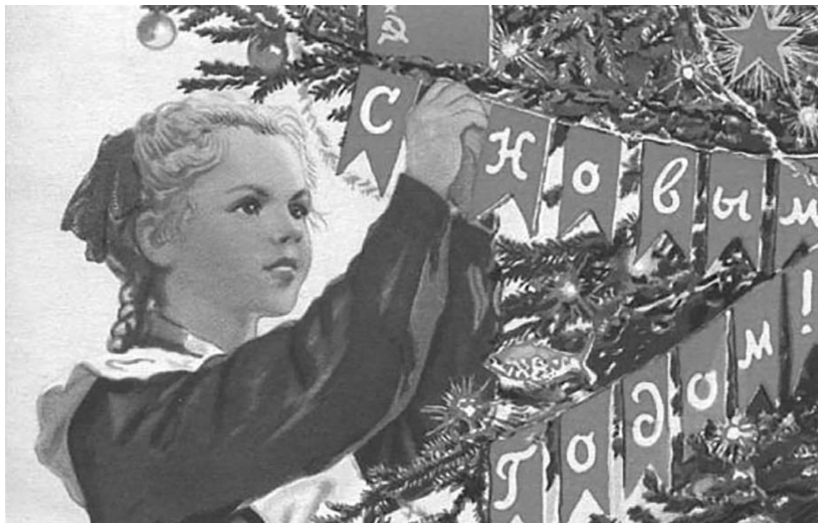
Смотрите, смотрите, вот настоящая пионерка

мордашка незнакомой девочки расплывалась в большой масленичный блин. На прощание Элина девочке всегда подмигивала - левым глазом получалось ловко, а правым пока не очень. Девочка из шара, наоборот, здорово жмурила правый глаз, а левым только моргала - смешно и вроде бы немного грустно. Белые звезды на темном стеклянном небе светили ровно и ярко, предвещая новый день, полный больших забот, которыми наполнена любая маленькая жизнь.