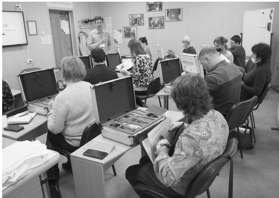
Обучение педагогов, которые привезут экомоданы в школы

- Наши партнеры имеют возможность обращать внимание на более тонкие и специфичные вопросы, связанные с созданием благоприятной среды для жизни людей. Если мы на текущем этапе нашей жизни все еще решаем базовые проблемы, связанные с нерациональным использованием тепла, воды и электричества или утилизацией мусора, то у финнов эти вопросы в целом уже проработаны. Они обращают более пристальное внимание, например, на такие аспекты, как уменьшение количества пищевых отходов в столовой, которые школьники выбрасывают после завтрака. Или снижение уровня шума на переменах с помощью установки специальных «шумовых светофоров». Популярна и тема «честной торговли» - покупки тех товаров, которые произведены без использования грязных технологий и без эксплуатации детского труда в развивающихся странах. А также вопрос приоритета местных товаров, это позволяет уменьшить выбросы в атмосферу, которые возникают при транспортировке товаров и продуктов из дальних стран. Сейчас такие подходы кажутся нам интересными, но не вполне соответствующими отечественному контексту. Однако контекст неизбежно изменится, и все то, что делают финны сейчас, очень скоро станет крайне актуальным и в нашей практике.