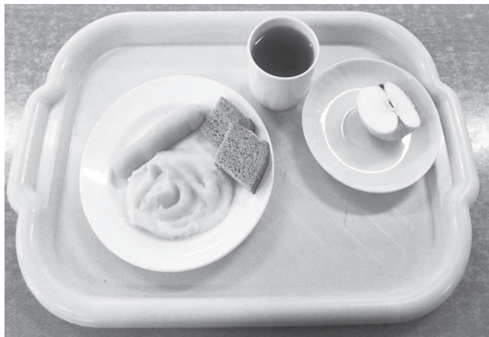
Бесплатное и правильное питание: синонимы?

В декабре 2021 года на заседании сессии по бюджету поднимала вопрос об увеличении расходов на бесплатное горячее питание школьников. Как все-таки обстоят дела с организацией питания в школьных учреждениях? В ФЗ «Об образовании в РФ» предусмотрены обязанности образовательных организаций в области организации питания обучающихся. В частности, организация питания, возлагающаяся на школу, предполагает выделение помещений