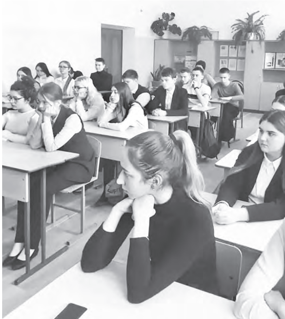
Преподавание - всегда процесс двусторонний

Как ученик, завершающий 11-й круг общего образования, знающий изнутри все, что происходило и происходит в классе, посоветую учителям одну вещь: общайтесь с учениками. Да, вы можете сказать, что у вас мало времени, много бумаг, отчетов, документации, других (!) классов (но ведь и у нас не меньше домашних заданий и есть другие (!) учителя). Никто не призывает общаться вечно, но, когда ученик после урока подойдет что-то узнать, не отвечайте ему/ей обрывисто, кратко (у всех бывает плохое настроение), попробуйте задать небольшой вопрос для рассуждения, для поддержания кратенького разговора. Поверьте, это в очень скором будущем возымеет эффект, вы получите авторитет, который не обретается двойками и неожиданными самостоятельными работами (этим культивируется страх, позже в худшем, но тем не менее возможном случае - ненависть к учителю как к человеку), - уважение среди учеников, и конспекты не пропадут зря. Удачи!