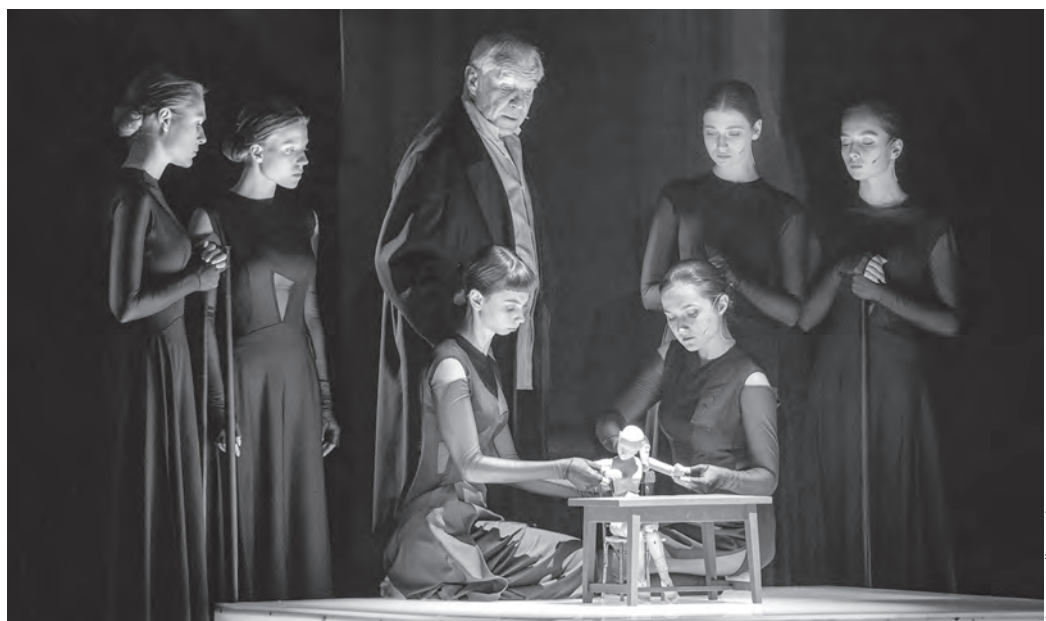
Война близких людей заканчивается трагедией, но победителей нет

Испугавшись его порывов, Кроткая выбрасывается из окна, обняв образ, которым когда-то осветила его жилище. Декорации по ходу действия приходят в движение, создавая иные пространства и подчеркивая существование главного героя как в реальных обстоятельствах, так и в фантастическом мире грез. На трагической ноте звучит финальный монолог Ростовщика. Гармаш произносит его, приклонившись спиной к возвышению, на котором лежит Кроткая-кукла. Он открыл «рай» в своей душе, но «мрачная косность» успела разбить то, «что все-