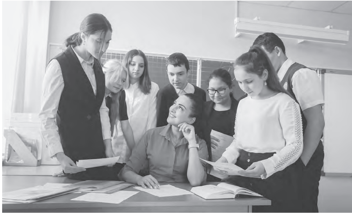
Когда учитель с учениками на одной волне