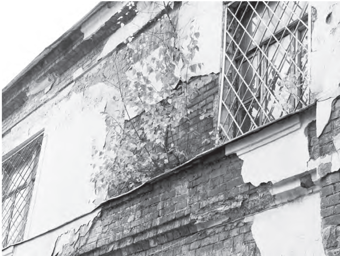
Надо ли радоваться тому, что молодое дерево разрушает старое здание?

Когда возникает тот или иной инфоповод, первая рефлекторная реакция корреспондента, журналиста, репортера, а теперь и блогера - как можно быстрее рассказать об этом как можно большему количеству людей. Неудивительно, ибо СМИ (а блоги тоже по праву можно причислить к таковым) призваны информировать народ о том, что происходит вокруг. Правда, тут неминуемо возникает проблема: чем быстрее ты обо всем сообщишь, тем меньше у тебя времени на то, чтобы разобраться в ситуации. Но чем дольше ты будешь разбираться, тем больше будет вопросов уже к тебе самому: в чем дело, где твоя реакция, другие уже по пять раз об этом написали, который день всю обсуждают, а ты все копаешься?! Опять же, если ты по горячим следам напишешь одно, потом выяснится, что все было совсем не так, придется всякий раз оправдываться, извиняться за то, что ввел людей в заблуждение. И так далее.