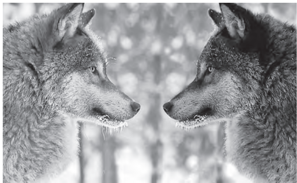
О преданности волков друг другу можно слагать легенды

Отдельного упоминания заслуживают кошки. Их еще называют китами-убийцами или морскими волками. Это самое большое и сильное хищное млекопитающее на Земле из семейства дельфиновых, распространенное почти по всему Мировому океану. Питается