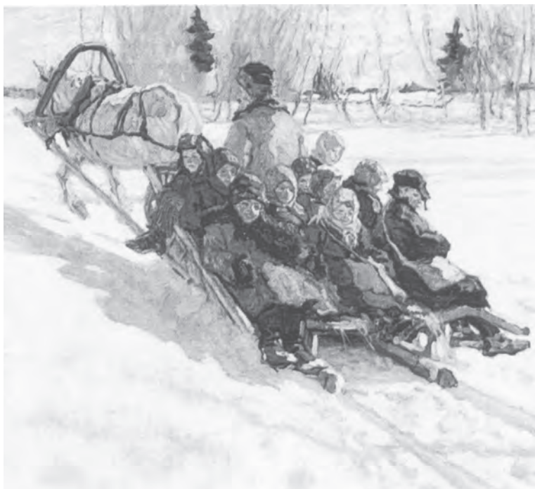
В школу - на санях

В Википедии можно встретить такое заключение: «Гендерная модель воспитания в современном мире неконкурентоспособна». Мы не будем с этим спорить. А просто еще раз построим для себя картины школьной жизни, отраженной как в документальных источниках, так и в искусстве. И увидим, что образовательная организация не может быть оторвана от практического функционирования семьи и государства. В школе все должно быть так, как в жизни.