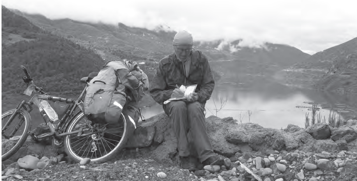
Одолев серпантин, наслаждаемся видами гор

...Перемена бытия обстановки - это перемена образа жизни. Стоик Сенека, который был вполне обеспеченным человеком, чтобы обрести внутренний мир, иногда представлял, что потерпел кораблекрушение, и так (ни с чем) отправлялся путешествовать. «Дорога - это жизнь», - до Сенеки или после него изрек его земляки, однако именно в дорожных мытарствах философ видел выход своим страстям. Без сомнения и натяжки можно сказать, что дорожное бытие - это прежде всего походный быт. Кстати, термин с полным соответствием понятию «быт» отсутствует в других языках. По-болгарски это «живот», по-итальянски - «вита», а в английском языке - way of life. В переводе тут «путь». Есть путь - будет и жизнь. Мой походный быт прост и незамысловат. Если надо постирать футболку, я просто окунаю в ней в реку, или дождик ее раз-другой прополощет. Иногда, правда, сердобольные хозяйки устраивают мне постирушку. Это как бы мой быт, но не совсем. Тем более это случается редко. Иногда, правда, бытовые походные неурядицы выбивают из колеи, застав-