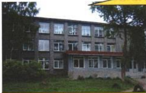
МОУ Шуйская средняя школа №1