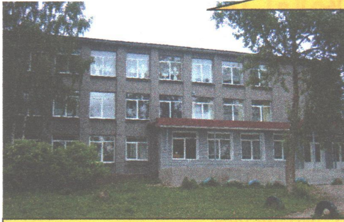
МОУ Шуйская средняя школа №1