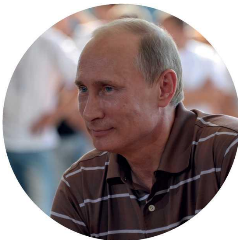
Владимир Владимирович Путин Президент России

В целях совершенствования государственной политики в области воспитания подрастающего поколения, содействия формированию личности на основе присущей российскому обществу системы ценностей Указом Президента Российской Федерации 29 октября 2015 года была создана Общероссийская общественно-государственная детско-юношеская организация «Российское движение школьников».