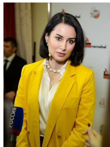
СОПРЕДСЕДАТЕЛЬ ОРГАНИЗАЦИИ: Канделаки Тинатин Гивиевна генеральный продюсер федерального спортивного канала "Матч ТВ", журналистка, общественный деятель

В настоящее время региональные отделения РДШ созданы во всех субъектах Российской Федерации. Избраны председатели и Советы региональных отделений, в которые вошли представители организаций - учредителей движения, осуществляющие свою деятельность в субъекте.