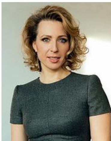
ЧУРИКОВА Яна Алексеевна, российская телеведущ а, журналист и общественный деятель, руководитель каналов молодёжного и музыкального вещания холдинга Viacom