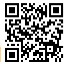
Фото с Форума