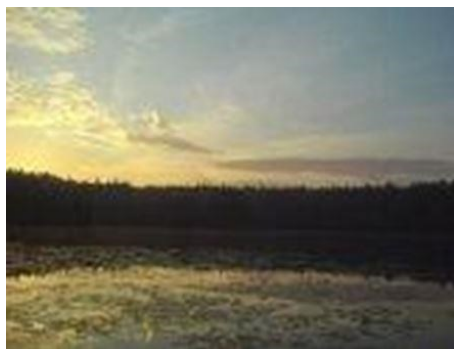
Рассвет на озере Свято