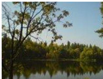
Виды на озере Глубоком