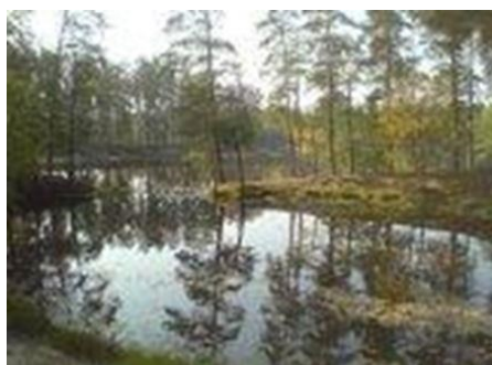
Залив на берегу озера Глубокого