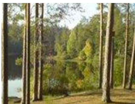
Утро на озере Свято