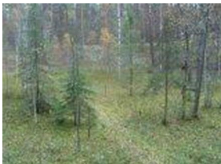
Торфяное болото на берегу озера Свято