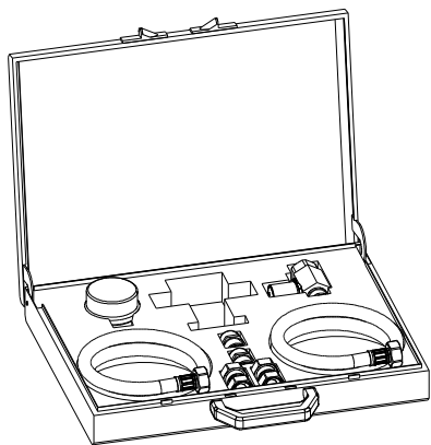
Abb. 1: GENO-therm® Koffer Basic