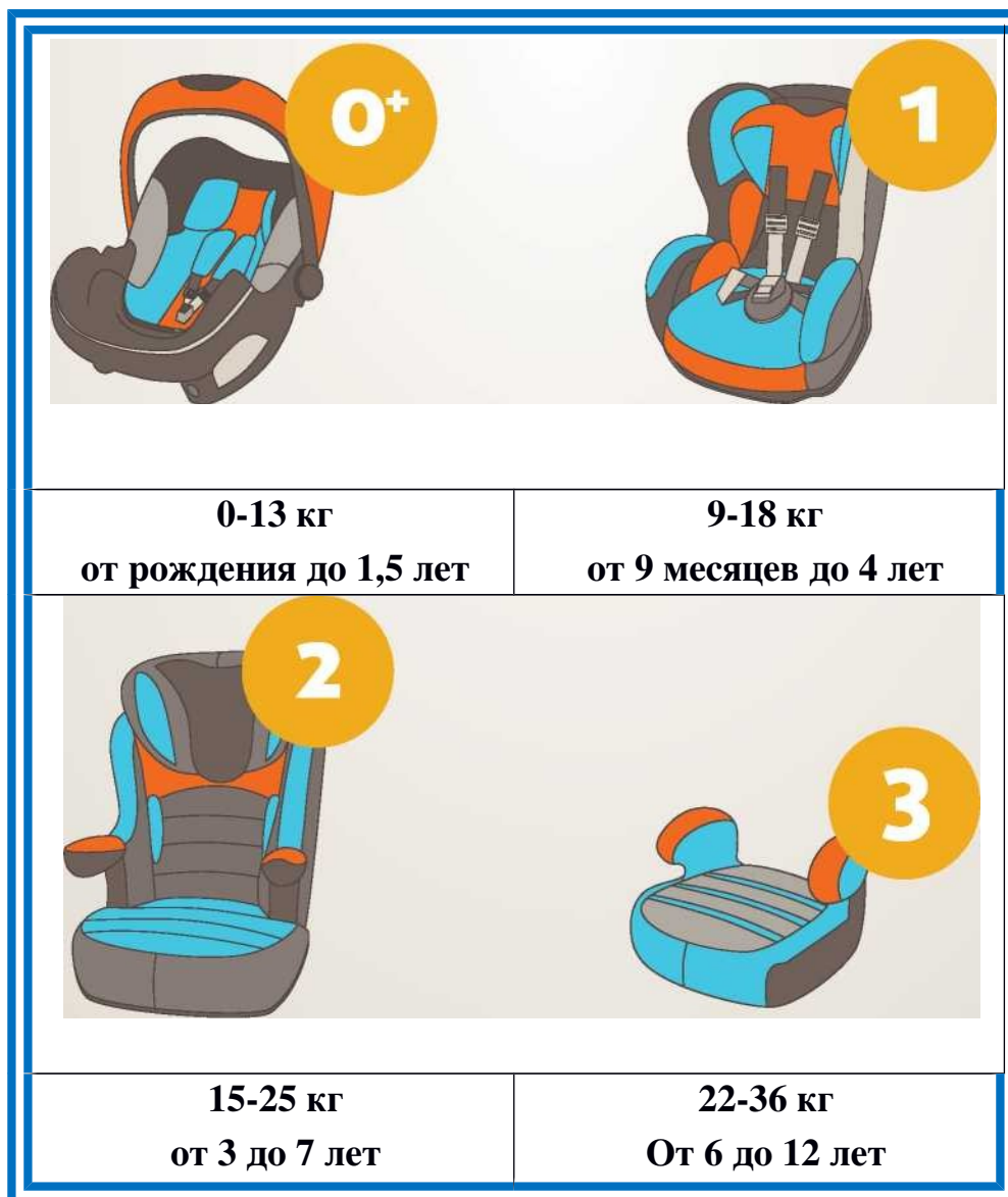
Рисунок 1. Виды детских удерживающих устройств.

Позиция Госавтоинспекции заключается в том, что ребенка в возрасте от 8 до 12 лет как можно дольше надо перевозить в автомобиле именно с использованием детского удерживающего устройства, обеспечивая тем самым наиболее безопасные условия перевозки.