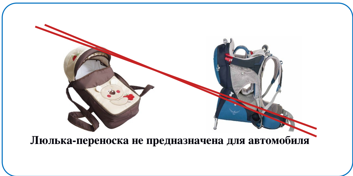
Рисунок 3. Внешний вид люльки-переноски

Конечно же, в специальной автолюльке или автокресле категории «0+». Выбирать специальное кресло для новорождённых нужно с особой тщательностью. Хотя оно прослужит недолго, родителям необходимо изучить сертификаты и отзывы о каждой конкретной модели, оценить анатомическую форму, качество встроенных ремней и надёжность фиксаторов. Рекомендуется обратить внимание на материалы внутренней отделки самой автолюльки, они должны быть гипоаллергенными и нескользящим. Следует продумать одежду малыша, так как в автолюльке он закрепляется трехточечным ремнем, проходящим через плечи и между ног. Детские игрушки, взятые в дорогу, должны быть мягкими.