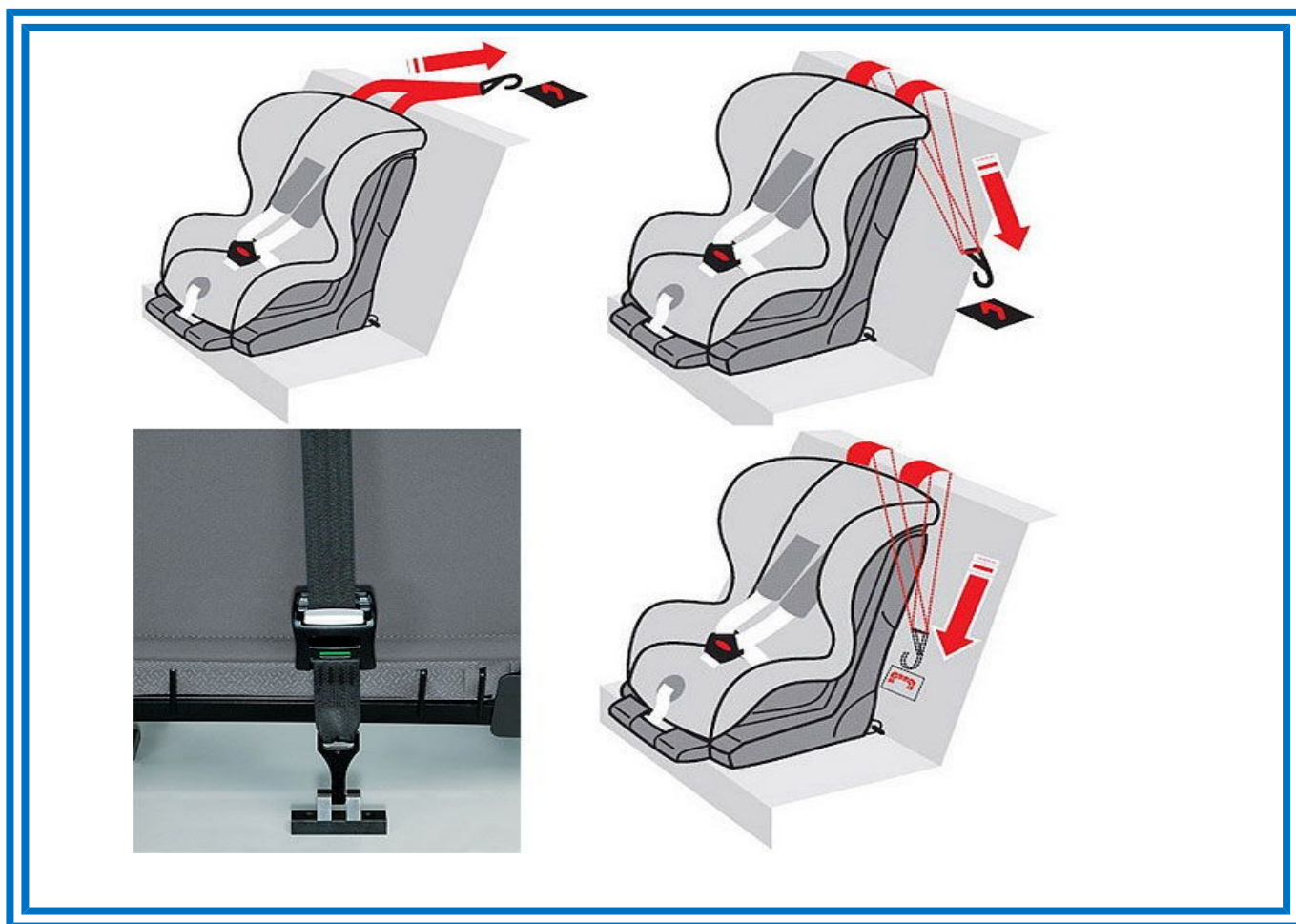
Рисунок 7. Способы фиксации якорного крепления

После того, как автокресло установлено, необходимо учесть ряд условий при усаживании в него ребенка.