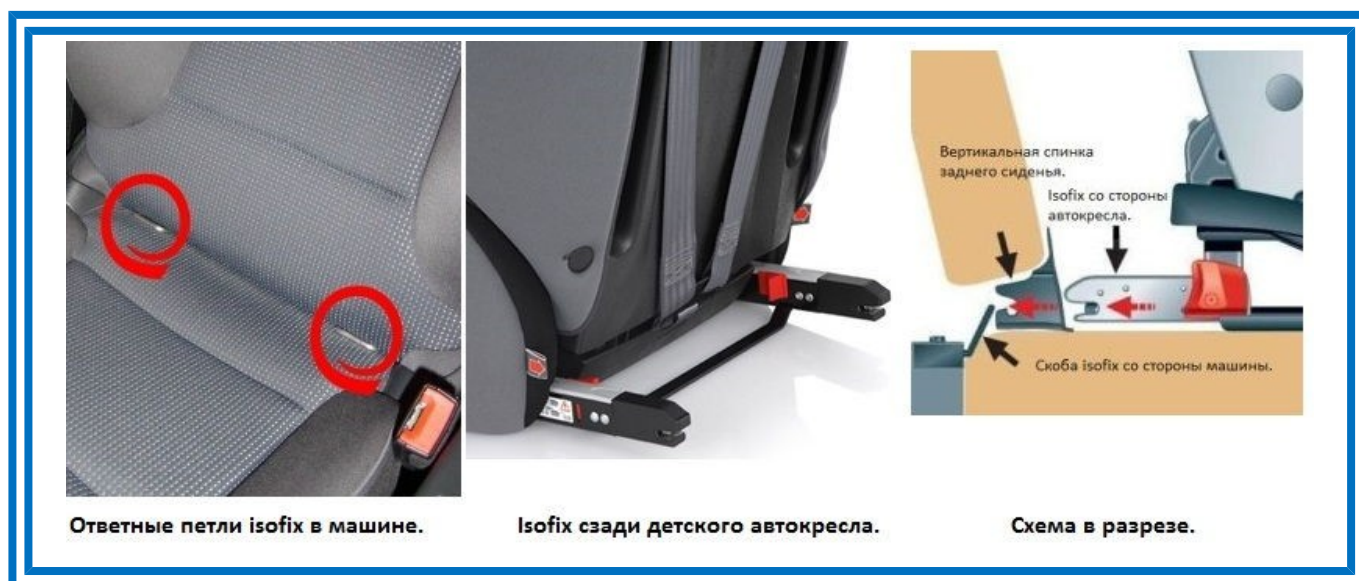
Рисунок 5. Крепления ISOFIX

Крепления ISOFIX как самостоятельные используются для автокресел групп 0+/1 (до 18 кг), в которых ребенок фиксируется ремнями безопасности автокресла, которое в свою очередь к автомобилю крепится непосредственно системой ISOFIX.