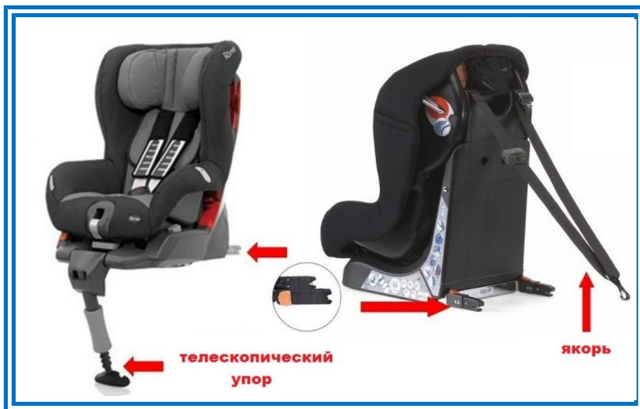
Рисунок 6. Телескопический упор и якорное крепление

Телескопический упор, который еще называют «упорная нога», чаще всего используется в автокреслах с системой Isofix для упора в пол автомобиля, что обеспечивает более жесткую фиксацию детского автокресла.