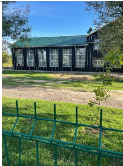
5. Фасад: утепление стен под сайдинг.