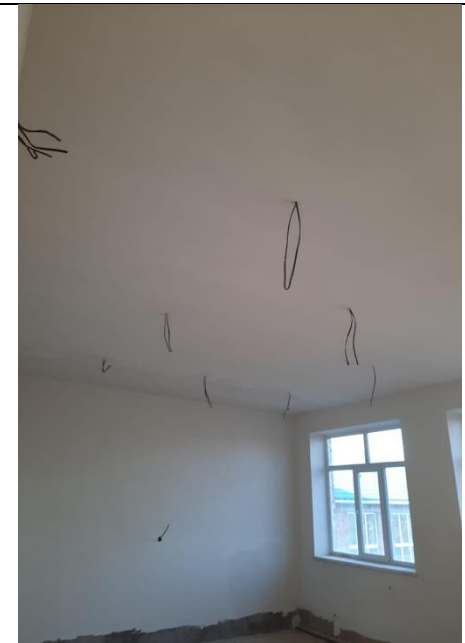
2) Штукатурка стен: