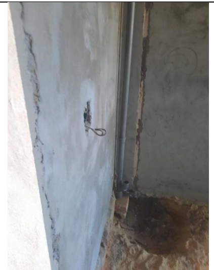
9. Внутренние инженерные системы: электрика