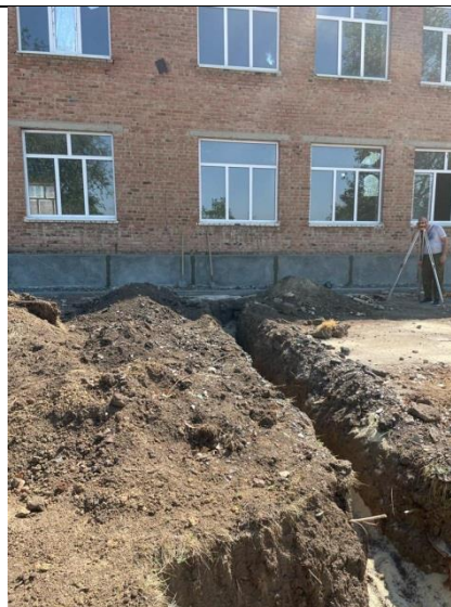
2) Водосточные системы кровля: