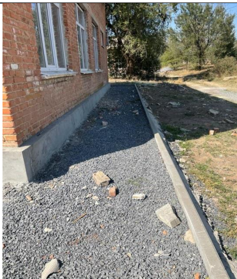
3. Усиление конструкций здания 100%