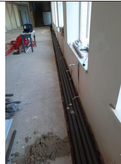
8. Внутренние инженерные системы: сантехника