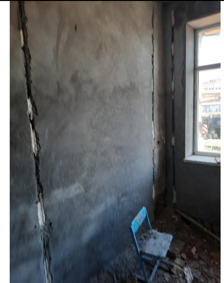
3) Стяжка под полы (чистовая):